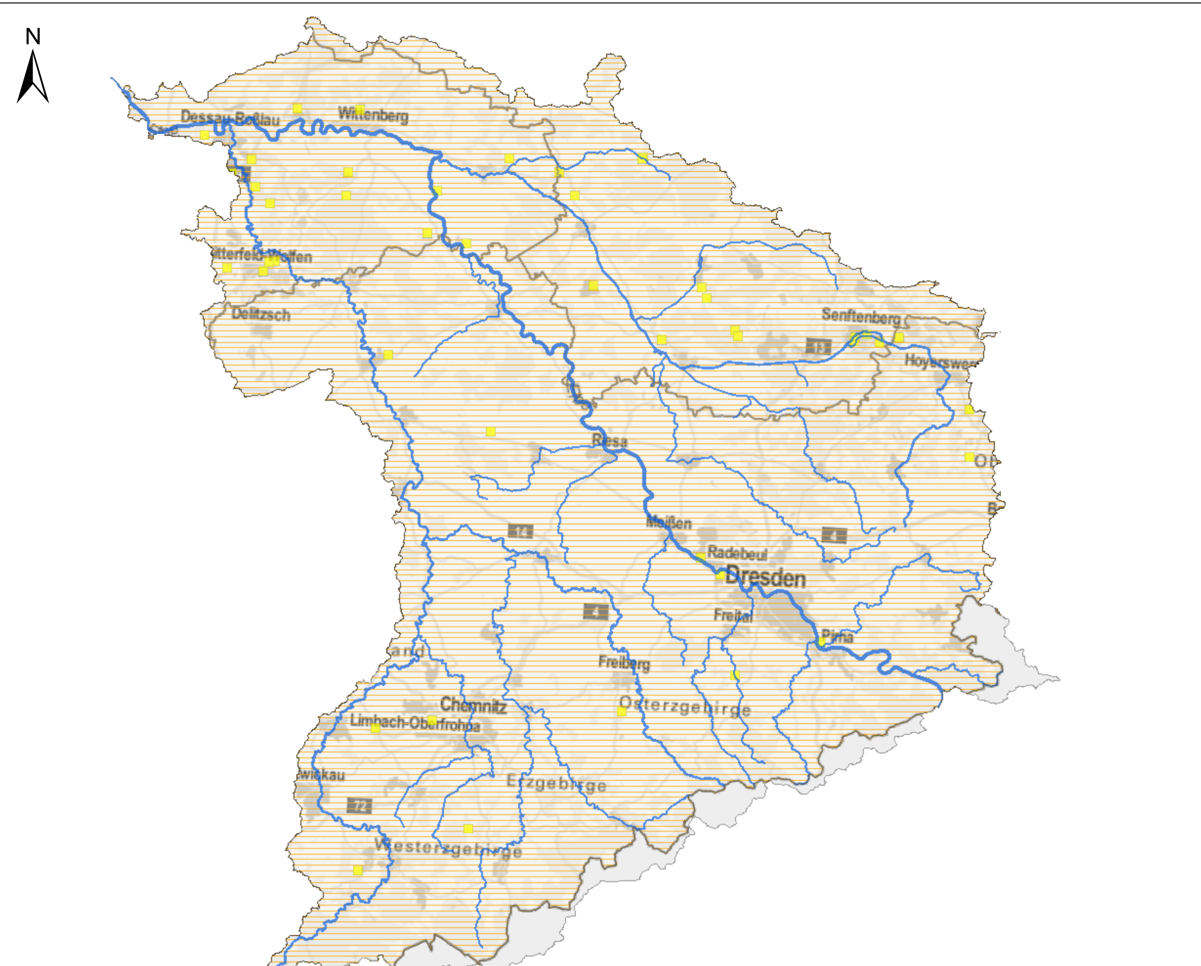
KOR Mulde-Elbe-Schwarze Elster - Karte 1.6: Schutzgebiete II: Badegewässer, Nährstoffsensible Gebiete